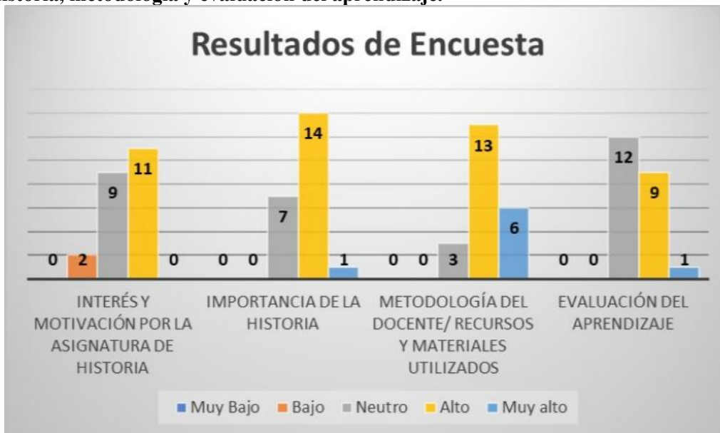
Gráfico 1. Resultados del diagnóstico inicial sobre interés, motivación, importancia de la Historia, metodología y evaluación del aprendizaje.