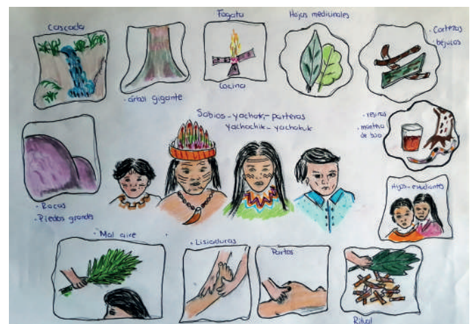
Fig. 1. Elementos que integran el paju .

A partir del análisis realizado, se identifica la concepción del paju de dos formas: como un saber ancestral y como un poder espiritual. Como saber ancestral, implica un conjunto de conocimientos, prácticas y valores construidos y preservados de generación en generación por los pueblos y las nacionalidades indígenas; estos a su vez tienen una relación profunda con la naturaleza, la espiritualidad y la comunidad (Figura 1). Desde posturas como la de De Sousa Santos (2009), los saberes ancestrales deben reconocerse como conocimientos válidos, que hacen frente al monopolio epistemológico de la ciencia moderna.