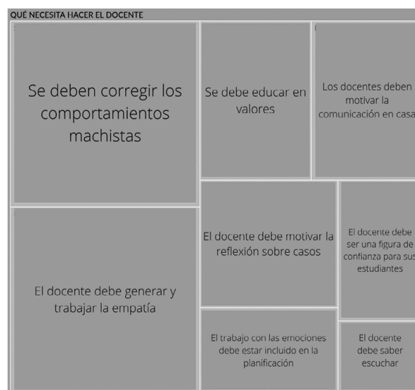
Figura 2. Incidencias del grupo focal: Qué necesita hacer el o la docente

Comparando a lo que nosotros recibimos en sus módulos y talleres, yo conocí mucho más de términos, que hay leyes, se podría decir que yo no sabía que había tipos de violencia, tenía conocimiento, pero no sabía que había como seis. Fue como que, un cambio brutal, porque no sabía que había más cosas de lo que había recibido cuando era adolescente. (N. I., comunicación personal, 11 de marzo de 2022)