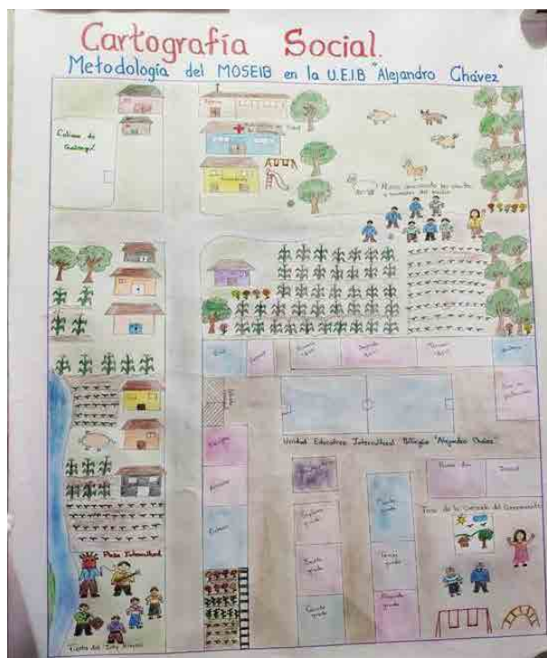
Figura 3: Aplicación del proceso metodológico del MOSEIB representado mediante cartografía social