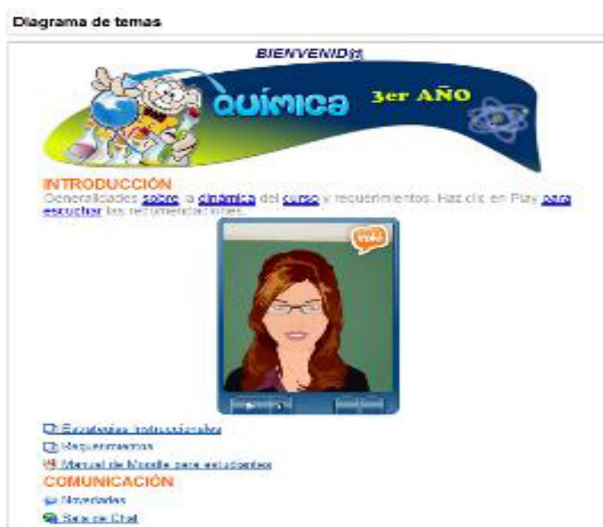
Fig. 2. Pantalla principal del AVA