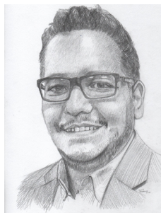
Retrato por Luis Reinoso

A inicios del mes de octubre del 2019, desde las diversas cátedras a mi cargo (Psicología del Aprendizaje, Metodología de la Enseñanza, Diseño Curricular, etc.) empecé a proponer a mis estudiantes una temática bastante cuestionadora llamada La Educación Soñada, aunque podría sonar un tanto subjetiva o romantizada, se buscó darle una perspectiva crítica y, sobre todo, transformadora. Pues si algo se tiene claro es que los procesos educativos a nivel básico y bachillerato dejan al descubierto un conjunto de situaciones complejas (adoctrinamiento, implementación de métodos tradicionales, enfoque centrado en los contenidos y no en las personas) que se vienen repitiendo de generación a generación, a las que desde la academia con la perspectiva pedagógica artística, se pueden proponer soluciones.