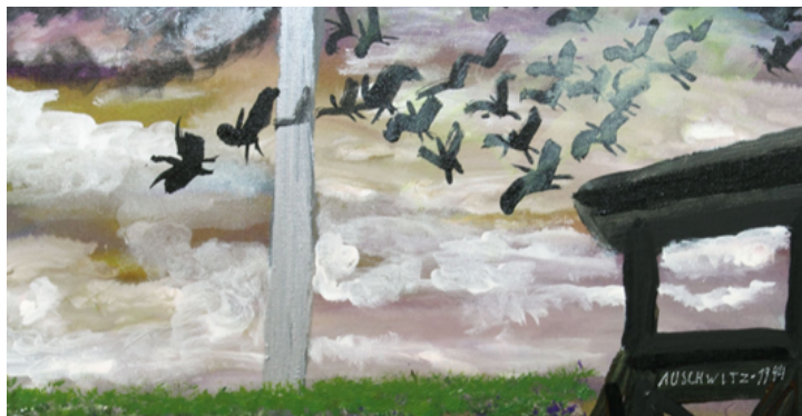
Figura 1. Ceija Stojka, La Maison Rouge (2018).

En este cuadro la artista trata de transmitir unas vivencias particulares, que representan el miedo y la supervivencia del Holocausto. Al observar la obra podemos apreciar la manera en la que ha pintado, su técnica Naif, como si una pequeña niña se hubiese atrevido a plasmar un recuerdo. Con esta referencia pasamos a lo siguiente, si para esto no hay restricción de creatividad, técnica, edad, expresión y entre otras cosas ¿Por qué en la educación la hay?