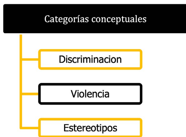
Figura 1: Categorías conceptuales para el análisis y revisión del contenido

Después de recopilar información y analizar cada uno de los artículos, se determinaron categorías temáticas que incluían el contenido útil para comprender esta problemática.