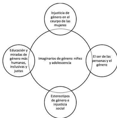
Figura 4. Cuestionamientos y reflexión sobre imaginarios y estereotipos de género