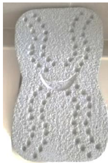
Figura 2. Imagen propia de la Taptana UNAE – Proyecto de Innovación UNAE-1-CPIE-001