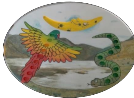
Figura 3. Uña Taptana – recurso para la comprensión del número – Proyecto de Innovación UNAE-1-CPIE-001