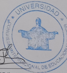
Coordinador del Taller