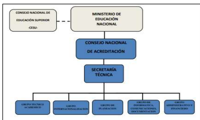
Figura 2. Organigrama del Consejo Nacional de Acreditación

El CNA se encuentra conformado por un grupo colegiado de 7 miembros (consejeros) de orden académico que son elegidos por la comunidad académica, su función es "promover y ejecutar la política de acreditación adoptada por el CESU y coordinar los respectivos procesos; por consiguiente, orienta a las instituciones de educación superior para que adelanten su autoevaluación; adopta los criterios de calidad, instrumentos e indicadores técnicos que se aplican en la evaluación externa, designa los pares externos que la practican y hace la evaluación final" [23].