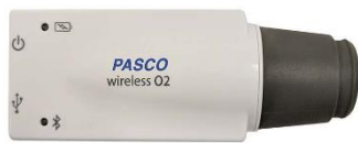
Figura 3. Sensores para la medición de la concentración de oxígeno en el aire y algunas de sus características.