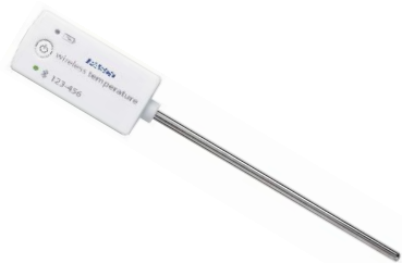
Figura 1. Sensor para la medición de temperatura y alguna de sus características.

Este sensor duradero, inalámbrico, de alta resolución cuenta con una sonda de temperatura de acero inoxidable para las aplicaciones más exigentes. Se puede usar en una amplia gama de experimentos y actividades, ya que mide cambios de temperatura pequeños pero significativos producidos por reacciones químicas, corrientes de convección e incluso temperaturas de la piel.