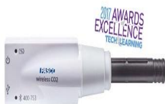
Figura 2. Sensor para la medición de la concentración de CO 2 en el aire y algunas de sus características.

Especificaciones: Distancia: 0 a 100,000 ppm. Resolución: 2 ppm. Exactitud: 0 a 1000 ppm: ± 100 ppm; 1000 a 10,000 ppm: ± 5% de lectura + 100 ppm; 10,000 ppm a 50,000 ppm: ± 10% de la lectura; 50,000 - 100,000 ppm: ± 15% de lectura. Conexión: USB; Bluetooth® 4. Duración de la batería: 18-24 horas de uso continuo ya sea cuando está conectado a dispositivos o en modo de registro. Ambiente de trabajo: 0-50 ° C; 0-95% de humedad relativa. Tiempo de calentamiento: 180 segundos. Tiempo de respuesta: 90% en 30 segundos.