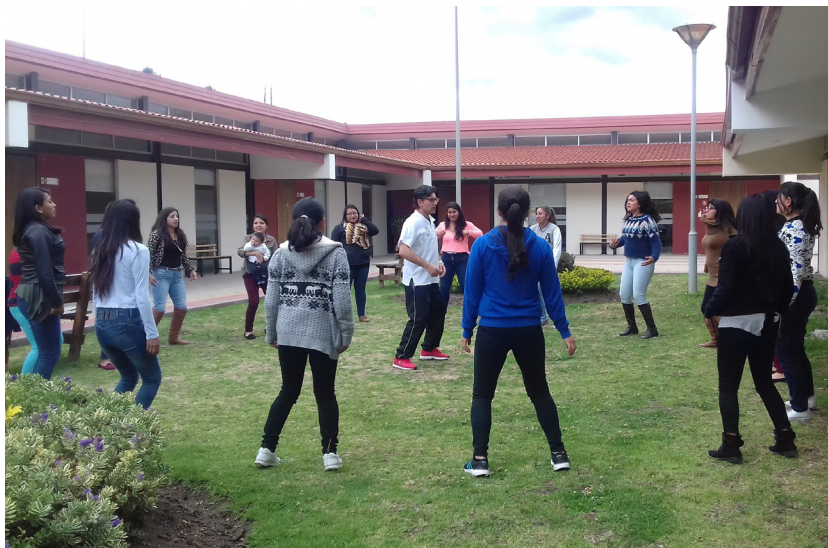
Figura 3: Ritmo, movimiento y percepción (autónoma y colectiva)