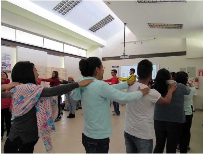
Figura 2: Dinámica de tacto y contacto