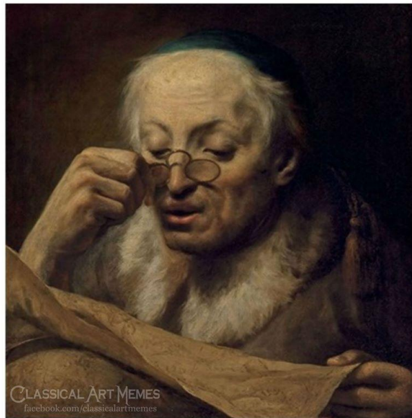
Imagen 4. Classical Art Memes

When you see a meme that you haven't seen before