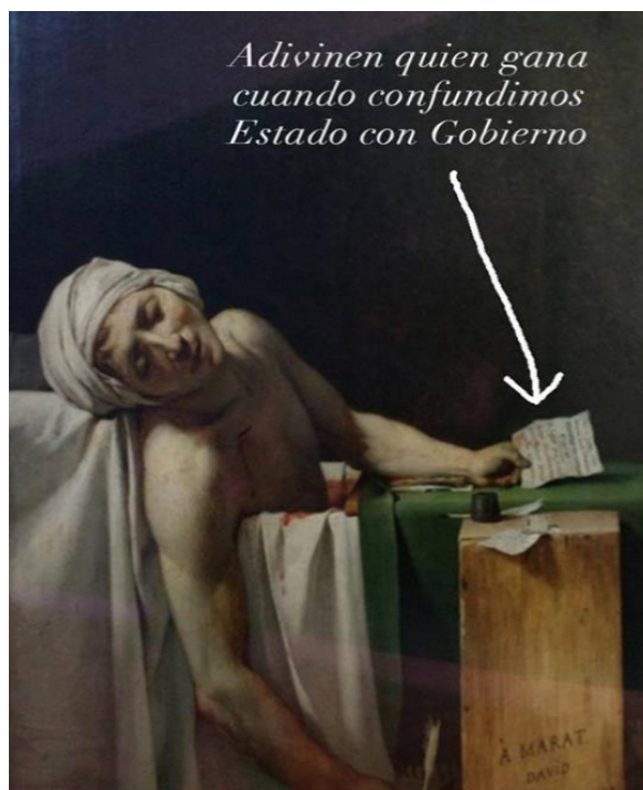
Imagen 7. Obra de la exposición virtual "Start-Up", Arturo Cariceo.