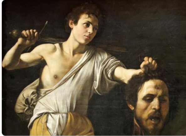
Imagen 1. #RebautizaTuObraDeArte