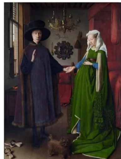
Imagen 2. Para amantes de la pintura

Si todo el mundo, incluidas las mujeres, se parecen a Putin, es Van Eyck