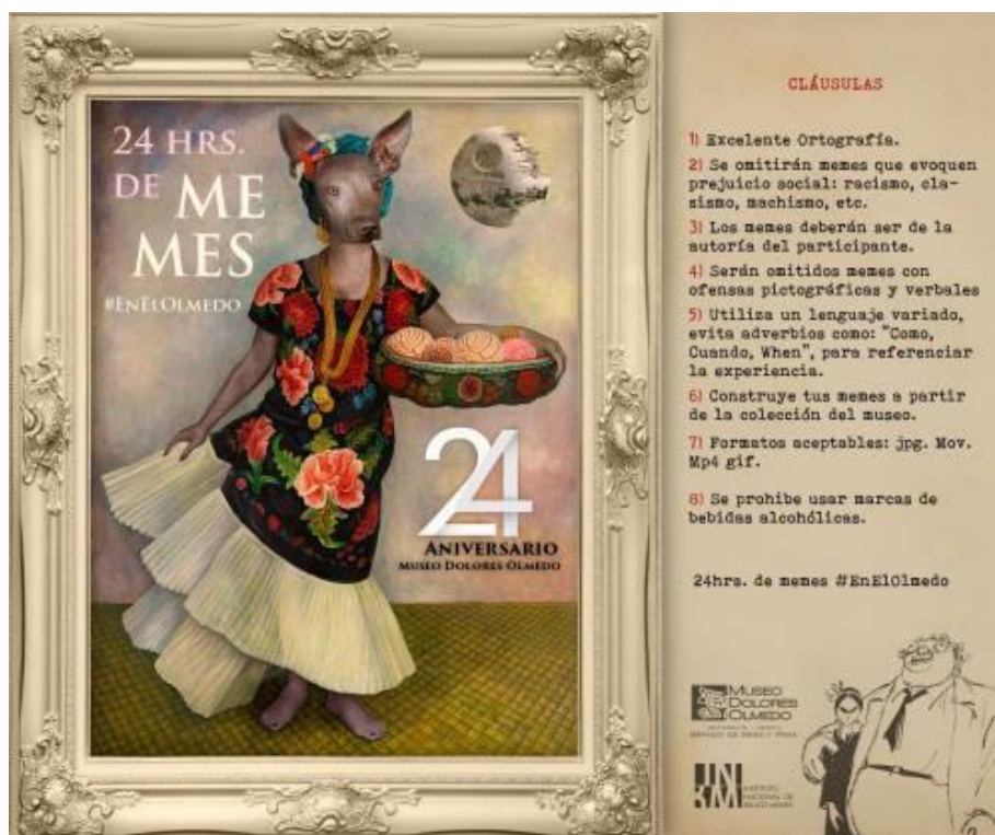
Imagen 8. Bases del concurso “24 horas de Memes en el Dolores Olmedo”

Las bases del concurso se dieron a conocer como se muestra en la imagen 8