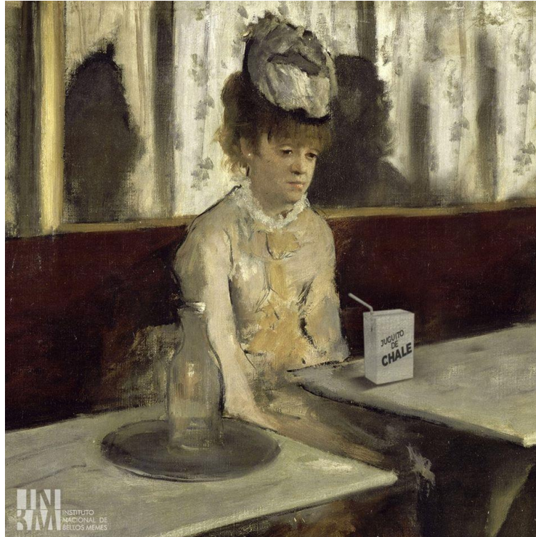
Imagen 3. Embriagarse hasta perder la autocompasión