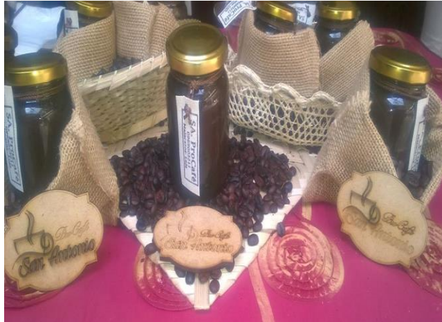
Figura 2. Presentación del producto: Emprendimiento ProCafé.

mostrar al público otra manera de consumir el café, este producto fue presentado en envase de vidrio y una tapa dorada con botón. Se observa en los siguientes gráficos, la presentación del producto y exposición de estudiantes.