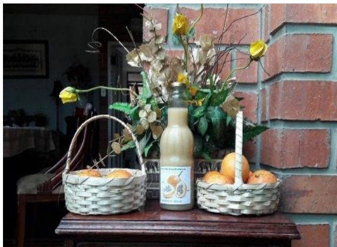
Figura 1. Presentación del producto: Jugo de Granadilla con miel de abeja.

Proyecto creado para la elaboración y preparación de jugo de granadilla con miel de abeja, la materia prima se la encuentra disponible en la provincia de Loja; además tanto la fruta como la miel de abeja se la ubican en cualquier época del año. En el entorno lojano, la mayor parte de la población consume granadilla, por ese motivo, el grupo de emprendimiento, utilizó la fruta para realizar el jugo con miel de abeja. A continuación, se aprecia la presentación del producto y exposición de estudiantes.