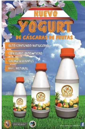
Figura 3. Presentación del producto: Yogurt natural y nutritivo hecho a base de cáscaras de frutas “SillipiMix”