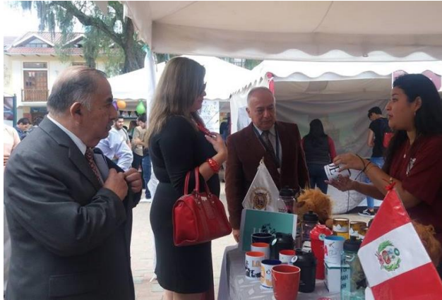
Figura 5. Exposición de Emprendimiento: Merchandising “Único”