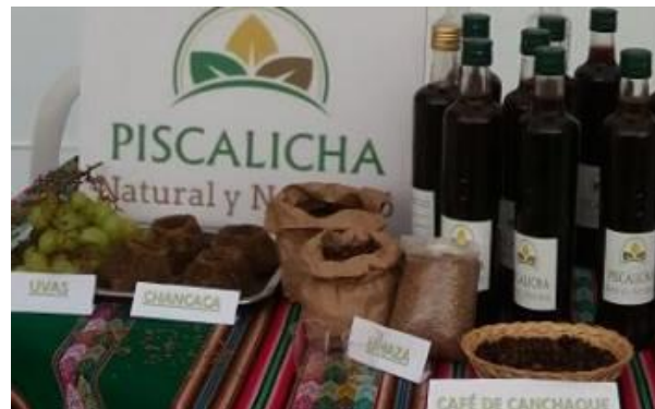
Figura 4. Exposición de Emprendimiento: Piscalicha

La Piscalicha es un aperitivo innovador 100% orgánico, es una bebida deliciosa, natural, nutritiva y saludable, además de ser energética, digestiva, antioxidante, vitamínica; por sus componentes es preventiva de enfermedades degenerativas, entre otras. Es un producto que impulsa el desarrollo de los componentes de la bebida, siendo esta fuente generadora de recursos para productores de insumos. En los gráficos se evidencia el trabajo desarrollado por el presente grupo.