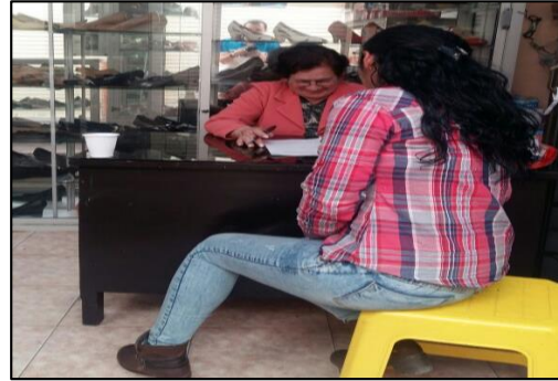
Figura 1: Encuesta aplicada a comerciantes