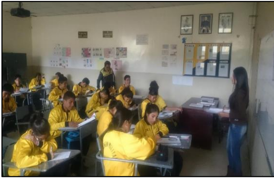
Figura 1: Encuesta aplicada a estudiantes de Bachillerato del colegio Militar Lauro Guerreo

A continuación, se ubican las imágenes de las encuestas desarrolladas a los participantes.