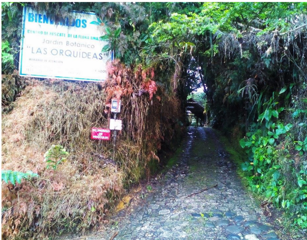
FOTO 1. Entrada al Jardín Botánico las Orquídeas