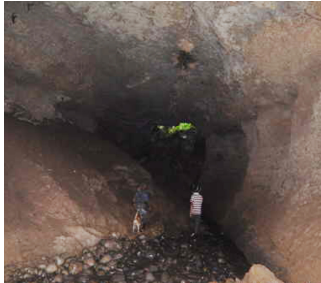
FOTO 3. Cavernas Fátima

Los servicios turísticos ofrecen el servicio de guía, hospedaje en una cabaña típica (la que se encuentra en reparación), y alimentación, la cual es necesario solicitarla con previa anticipación. Existe una tienda de artesanías. El Jardín Botánico las Orquídeas se ubica en el Barrio Obrero de la ciudad de Puyo siguiendo el sendero del Paseo Turístico del Río Puyo por unos 200 metros. Junto al segundo puente colgante del sendero, a la derecha se encuentra la entrada principal al Parque Omaere. El parque atiende todos los días, de 9 am a 5 pm. Visitas en otro horario previo cita. Los precios son $3,00 para adultos, $1,50 para estudiantes con identificación, y $0,50 para niños. En caso de familias grandes y grupos de 20 o más personas pagan solamente $2,00).