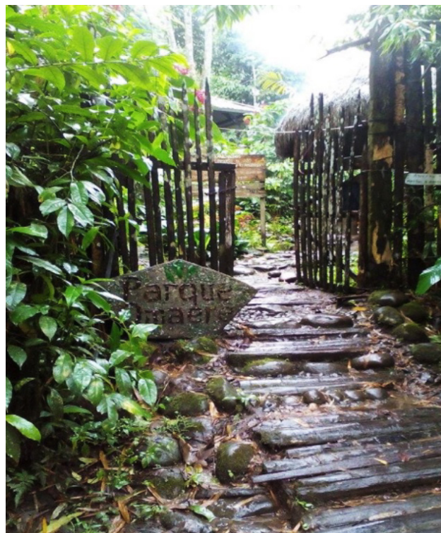
FOTO 2. Entrada al Parque Etnobotánico Omaere

no, en el centro de la ciudad de Puyo tome el urbano de la ruta #2, al frente de la Cooperativa de Ahorro y Crédito San Francisco, ubicado en las calles Atahualpa y 27 de febrero. Los urbanos están disponibles cada 25 minutos, la tarifa es $0,30 y el recorrido dura 20 minutos.