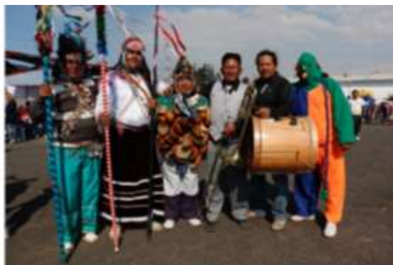
4. Personajes de La Yumbada y un músico, de izquierda a derecha: yumbo, yumba, yumbo mate, músico de orquesta, pingullero y mono San Luis de Calderón. 2016.

El mamaco o pingullero es el encargado de poner el ritmo a La Yumbada , para este efecto utiliza tambor y pingullo. Ataviado, carga el bombo cruzado desde el hombro, lo golpea con la una mano y maniobra el pingullo con la otra (ver anexo 4). No existe homogeneidad en cuanto a su vestimenta. Podría decirse que cada pingullero recurre a una estética dentro de lo que considera ceremonial formal: pantalón de tela, camisa, chaqueta y eventualmente una bufanda al cuello. El pingullero, a más de musicalizar la danza, está a cargo también de velar por su correcto desarrollo. El mamaco alecciona y llama la atención si observa a alguno de los danzantes bailando sin ánimo o decaído. Se lo ubica con claridad porque está generalmente en algún lugar central de la danza.