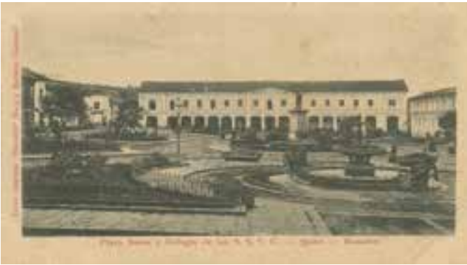
Colegio de los Sagrados Corazones de Jesús Quito - Ecuador

García Moreno marcó importantes hitos en la historia del Ecuador y dejó cimentadas las bases del cambio, (aunque aún en caos el país bajo su mandato), pudo desarrollar uno de los mejores métodos de educación del mundo, el traído por los Hermanos Cristianos y por las monjas de Los Sagrados Corazones. En su mandato fundó algunos de los colegios más importantes que hasta el momento tiene el país, a pesar de ser particulares y religiosos mantienen desde sus inicios sólidas bases en la formación, con el método simultáneo y con las debidas modificaciones a lo largo de la historia.