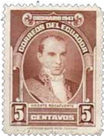
Vicente Rocafuerte 1783 - 1847

No extraña entonces que la enseñanza mutua encontrara sendos adversarios en los pedagogos más visionarios de aquel entonces. Entre ellos figuraba el célebre Maestro del Libertador, don Simón Rodríguez, quien motejó a este sistema de escuela del papagayo, pues afirmaba: “Mandar recitar, de memoria, lo que no se entiende, es hacer papagayos, para que por la vida sean charlatanes [...] Dar gritos y hacer ringorrangos no es aprender a leer ni a escribir” (Rodríguez, 1988, p. 247). Afirmaba Rodríguez que sí en la primera escuela se enseñara a raciocinar, habría menos embrollones en la sociedad.