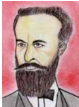
José Peralta.

Si de revolución y lucha, en el pensamiento ecuatoriano, se trata, es completamente indispensable hablar de José Bartolomé Peralta Serrano (1855-1937), nacido en Gualleturo, actualmente provincia de Cañar. Un niño que tuvo una vida dura al ser el hijo no reconocido de un clérigo. Creció con un fuerte sentido del derecho y de la lucha por la renovación de la humanidad. Al terminar su instrucción en jurisprudencia y encontrarse con grandes libros y ciencias, su mente sufrió un cambio, se dio cuenta de la injusticia que era recreada a diario por la Iglesia, como lo menciona en su libro Alfaro y sus victimarios: apuntes para la historia (2008):