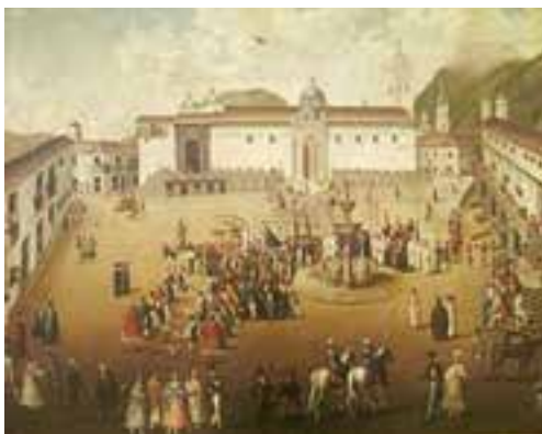
Centro histórico de Quito – La Plaza Grande s. XVII

que toma el pensamiento educativo. Por ello, podemos empezar hablando de la colonia como origen de los sistemas establecidos de orden disciplinar y discipular en la educación y sobre todo, en el territorio ecuatoriano, con figuras en la formación tanto del alumnado infantil y juvenil así como del profesorado de la época, recalcando que: