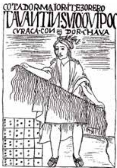
Kipukamayuk (escritor de Kipus) Guamán Poma de Ayala

Respecto a los demás pueblos indígenas del Ecuador, en los períodos anterior y contemporáneo a la Conquista Inca, no existieron instituciones educativas formales. Este hecho, sin embargo, no significa que dichas sociedades careciesen de sistemas educativos, ya que cuando hablamos de la especie humana aquello resulta imposible. La familia, los grupos de pares, las asociaciones de diverso