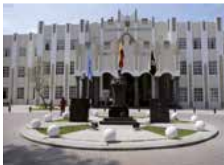
Fachada Colegio Vicente Rocafuerte – Guayaquil

A pesar del cambio de mandato y las nuevas corrientes que se despertaban en la pedagogía mundial es importante recalcar que el gobierno de Rocafuerte tomó la decisión de mantener el método de enseñanza, aclarando que: