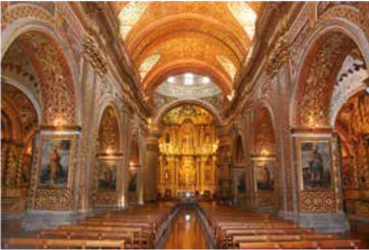
Iglesia de la Compañía de Jesús de Quito Joya mundial del arte barroco

Bolívar Echeverría llamó ethos barroco 11 , esto es, por los imaginarios del catolicismo canalizados a través de sus doctrinas, su arte y su retórica, y de otra parte, por las creencias y estéticas indígenas anteriores a la conquista. En otras palabras, se trata de un proceso de sincretismo, por el que nuestro pueblo se apropió de los símbolos del catolicismo, pero al mismo tiempo sobre ellos operó transformaciones y los dotó de sentidos y significaciones propias.