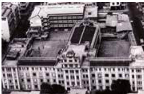
Colegio de los Hermanos Cristianos ‘La Salle’ Guayaquil – Ecuador

Sin embargo, Rocafuerte abre el abanico de posibilidades e instituye también el método simultáneo, esté en su época no tiene la acogida suficiente y es desplazado hasta otro momento en la historia.