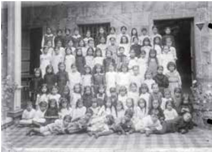
Escuela de niñas y niños. Cuenca-Azuay Ca. 1890-1909

En fin, directa o indirectamente, la influencia de la Escuela Nueva continúa presente en la formación de los docentes ecuatorianos. Nombres como los de Piaget, Montessori, Dewey, Decroly, etc., son familiares a los profesionales de la