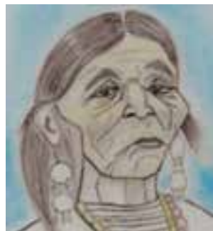
Dolores Cacuango. Ilustración de Edwin Dávila Lara

Lejos de su tierra pudo ver las contradicciones del mundo capitalista. Conmovida y decepcionada de la capital, decidió volver