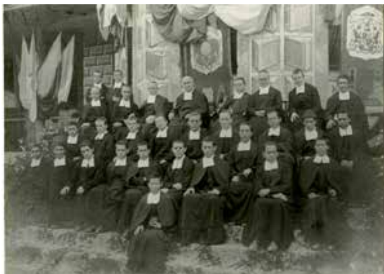
Hermanos de las Escuelas Cristianas de la Salle en el Ecuador Ca. 1870-1880

Puede señalarse que la escuela graduada tal como hoy se comienza a organizar en el Ecuador fue establecida por primera vez por los Hermanos de las Escuelas Cristianas, pues sus escuelas se componían de seis clases o grados distintos de enseñanza, cada uno regido por un profesor. Aún hoy los métodos seguidos no son otros que los que aquellos empleaban y que con ligeras modificaciones siguen los actuales maestros, discípulos directos de los miembros de aquella congregación educacionista (p. 110).