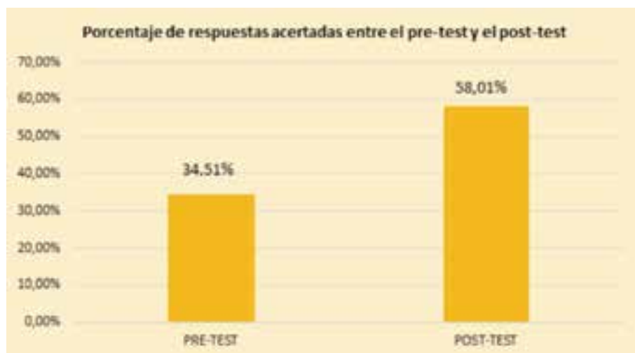
Gráfico 3: Porcentaje de respuestas acertadas entre el pre-test y el post-test