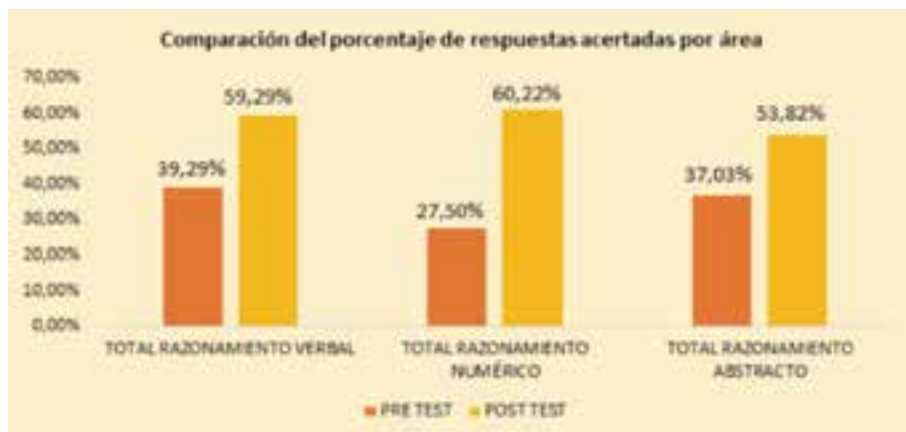
Gráfico 2: Comparación del porcentaje de respuestas acertadas por área