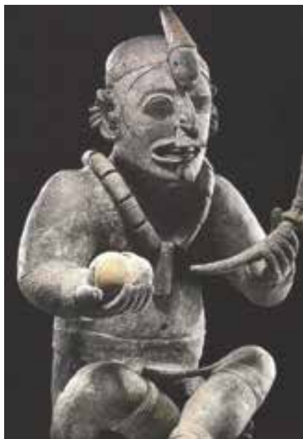
Sacerdote Cultura Jama-Coaque (355 a.C – 400 d.C.)

Las culturas precolombinas del Ecuador fueron evolucionando en los distintos períodos (Paleolítico, Formativo, Desarrollo Regional e Integración) hacia formas sociales cada vez más complejas, en un escenario donde la creciente especialización del trabajo produjo ciertos niveles de estratificación social. A guisa de ejemplo, tras analizar los restos arqueológicos de cultura material dejados por los pastos, María Victoria Uribe (1987) concluye: “la industria textil, orfebre, la talla de madera y la cerámica funeraria la hacen especialistas y su uso está restringido a la élite cacical” 3 (p. 216). La presencia de especialistas y de una determinada producción suntuaria para uso de una incipiente élite política, nos habla a las claras de una sociedad donde ciertos saberes eran privativos de grupos restringidos, saberes que se reproducían en su interior por medio de la educación.