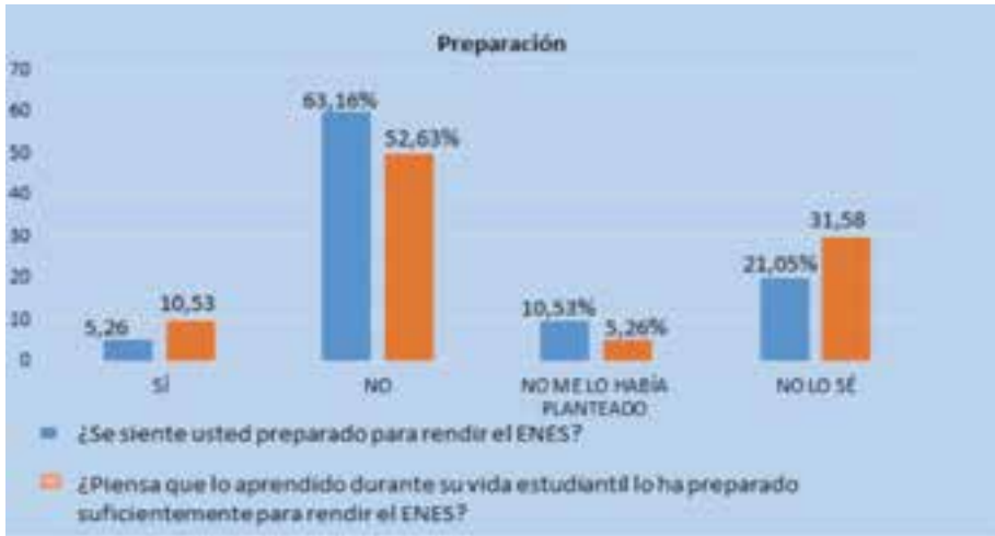
Gráfico 1: Entrevista aplicada a los estudiantes de nivelación

Fuente: Entrevista estructurada de respuestas cerradas aplicada a los estudiantes de nivelación Responsables: Autores