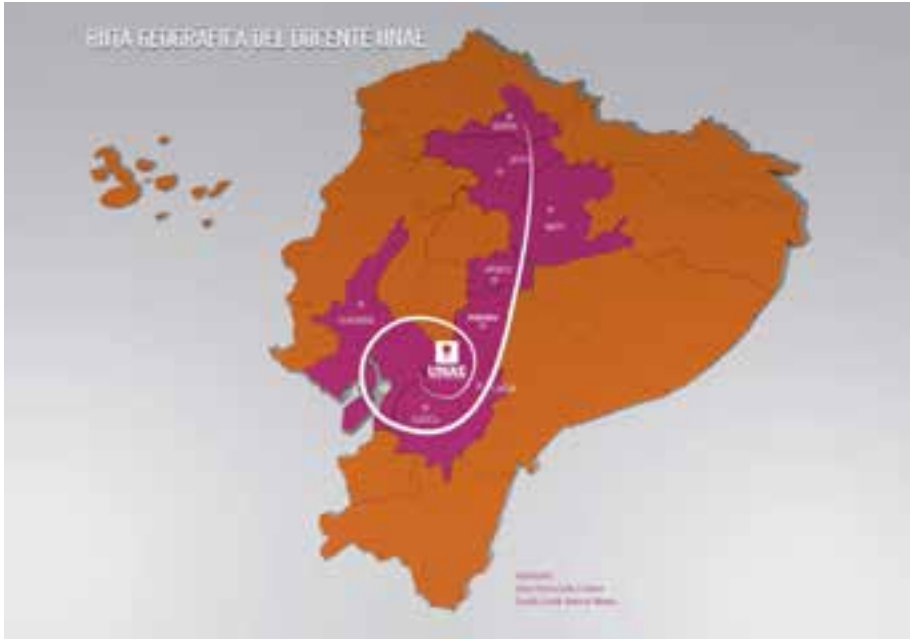
RUTA HISTÓRICA – GEOGRÁFICA DEL DOCENTE Ilustrado por: Jairo Vinicio Coba Limaico – Coralía Lizeth Jiménez Román

envueltos en la espiral de evolución y marcaremos los ciclos con inicios y finales designados por la investigación que se ha realizado respetando las épocas, espacios y sucesos de trascendental importancia para la formación del pensamiento educativo ecuatoriano.