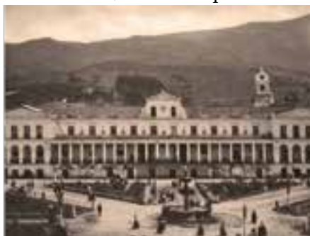
Fotografía del Palacio de Carondelet s.XVIIIX Quito – Ecuador