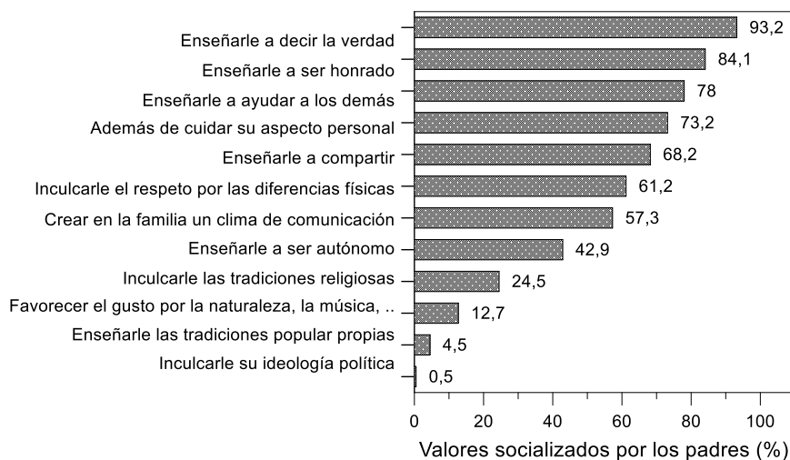
Figura 1. Grado de importancia (%) a factores de socialización según los padres.

Se identificó que en el proceso de socialización de valores aquellos a los que padres y madres dan mayor importancia son: la verdad (93.2%), honradez (84.1%), solidaridad (78%). Los que se consideran menos importantes son: valores políticos (0.5%), valores tradicionales (4.5%) y sensibilidad o gusto por la naturaleza, la música y la pintura (12.7%) (Fig. 1).