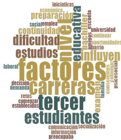
Gráfico 6. Retos y oportunidades de los estudiantes de tercero de bachillerato