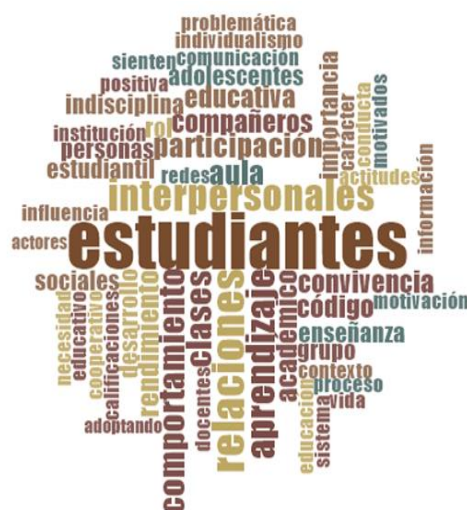
Gráfico 3. Relaciones entre pares y participación estudiantil

propone romper con el individualismo mediante el cooperativismo y la relación armónica entre pares.