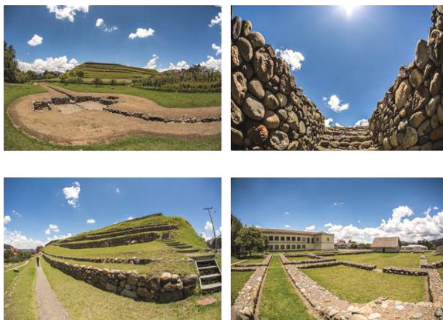
Figura 3. Parque Arqueológico Pumapungo (área urbana) (Juan Carlos «Tuga» Astudillo).

dar la nueva ciudad de Tomebamba (Inca Garcilaso de la Vega 1985).