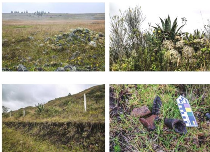
Figura 5. Estado actual de sitios prospectados (Juan Carlos «Tuga» Astudillo).

Sin embargo, debido a los cambios arquitectónicos y usos que se dan a la ciudad, sea por medio de mejoramiento de infraestructura, construcción o restauración de edificaciones —lo que implica remoción y alteración de tierra—, interpretamos como «parte sensible» los espacios del centro de la ciudad, dadas las implicaciones materiales que conlleva estar sobre un espacio considerado de sensibilidad e interés arqueológico (fig. 5). En tal sentido, los restos inmersos en la ciudad presentan el riesgo de ser alterados o simplemente destruidos por el crecimiento urbano, siempre y cuando no exista un ente regularizador que monitorice cualquier intervención que se realice en estos espacios. Por ello,