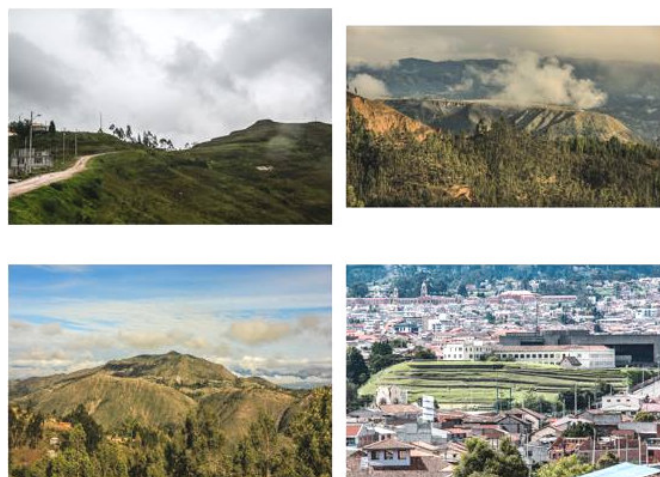
Figura 2. Espacios arqueológicos en Cuenca y sus áreas circundantes (Juan Carlos «Tuga» Astudillo).

La generación y agrupación de fotografías permite desarrollar un argumento interdisciplinar que evidencia la situación actual de los sitios y áreas arqueológicas de la urbe. Si bien en el registro arqueológico la fotografía es un medio necesario para demostrar la presencia del ser humano espacialmente, sin embargo el realizar-