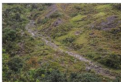
Figura 4. Sitios arqueológicos en áreas periféricas a Cuenca (Juan Carlos «Tuga» Astudillo).