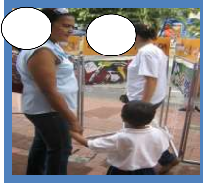
Imagen No.4. Juego“Ciudad Pensada”